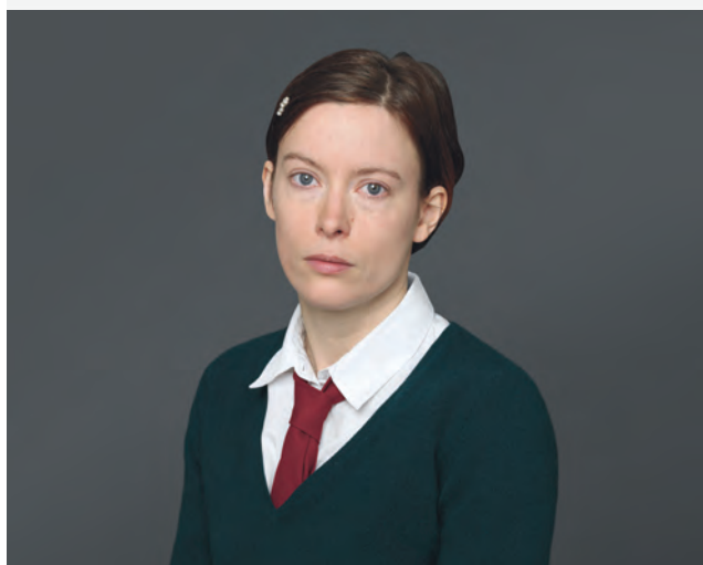
Foto uit: 'Till the fat lady sings', Toneelgroep Oostpool.

Voor meer informatie over bovenstaande activiteiten kunt u contact opnemen met de afdeling Marketing en Communicatie, tel 026 353 84 31.